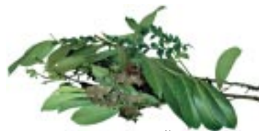
Déchets de jardin