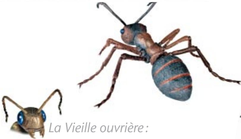
La Vieille ouvrière :