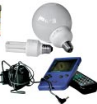
Appareils électriques et électroniques