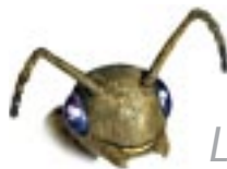
La Jeune ouvrière :

que les environs avaient changé. L'herbe était haute, comme si on ne l'avait jamais entretenue! C'était comme si les plantes, les arbres et les cailloux avaient changé de place durant la nuit! Les jours suivants, il a fallu créer de nouvelles routes et reconstituer les troupes de pucerons. Mais finalement, on s'en est bien tiré!»