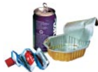
Aluminium et fer-blanc