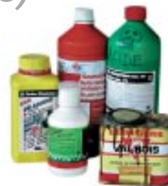
Produits de jardinage Restes de peinture Solvants et autres produits chimiques