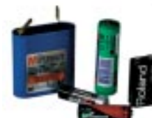
Piles et batteries