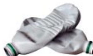
PE (Coop et Migros)