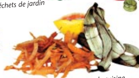
Déchets de cuisine